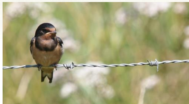
Boerenzwaluw op prikkeldraad

Boerenzwaluwen die de barre tocht van 9000 kilometer heen en weer terug hebben overleefd, keren jaar na jaar op dezelfde broedplaats terug. Meestal wordt het oude nest hersteld en opnieuw door het zwaluwpaar in gebruik genomen; dat spaart tijd en energie! Volgens een ruwe schatting broeden er in Nederland zo'n 100.000 tot 200.000 paren. Jaarlijks maken ze 2-3 legfels, ieder legfel met 4-5 eieren. Het nest is een schotelvorming open kommetje van aarde, vermengd met speeksel en strotjes.