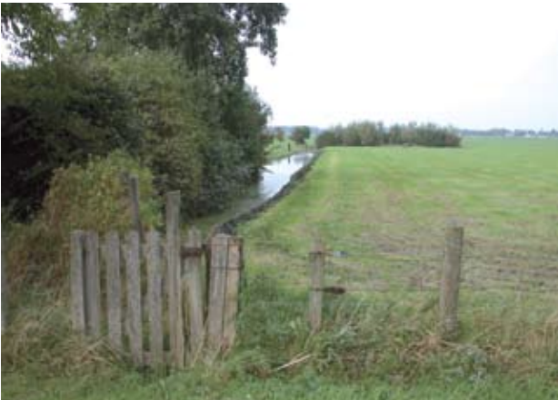
Het slotenpatroon staat haaks op de stroomrug, iets verder van de stroomrug af ligt een hakhoutbosje.

De meest typerende landschapselementen van de stroomruggen zijn de oeverbeplantingen van de Vecht, de landgoedbossen met stinzeplanten en de boomgaarden en bosjes. De buitens en landgoedbossen zijn beschreven in hoofdstuk 7.