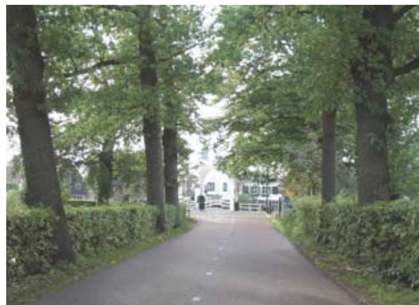
Haaks op de stroomrug van de zuidelijke Vechtstreek zijn laanbeplantingen langs wegen te vinden, zoals hier een eikenlaan met hagen.