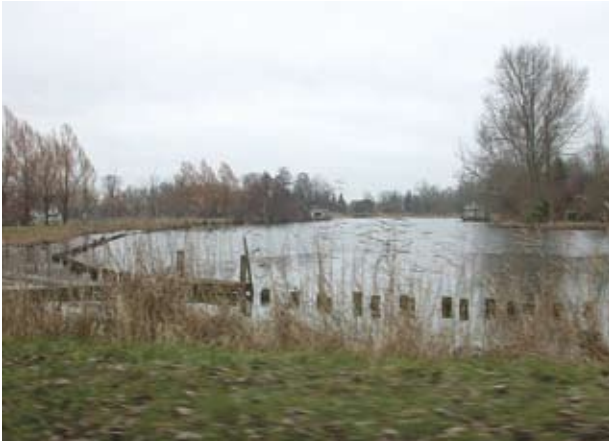
Oeverbegroeiing langs de Vecht van riet en moeras.