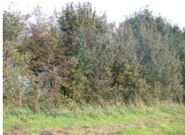
Meidoornstruwelen langs de Vecht.

Ook in de dwarslanen in de Vechtstreek Zuid komt de rijkere beplanting van deze stroomrug terug in soorten als eik en populier.