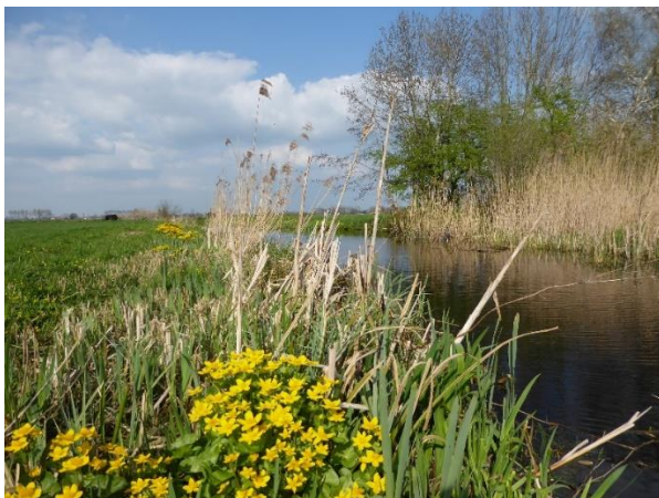
Foto Natuurvriendelijke oever

Twaalf boerenbedrijven die gelegen zijn aan de Slimmenwetering in Zegveld gaan aan de slag om 2.500 m aan natuurvriendelijke vooroevers aan te leggen. Collectief Rijn, Vecht en Venen heeft hiervoor subsidie aangevraagd bij POP3. De helft wordt gefinancierd door de EU uit het Europese Fonds voor Plattelandsontwikkeling en de andere helft door de Provincie Utrecht. Lees meer op onze website .