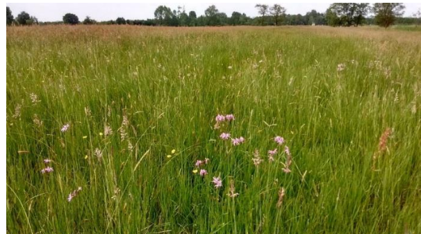
Foto natuurgrasland op Twitter

Graag wil RVV u wijzen op de cursus Inleiding beheer natuurgrasland die wordt georganiseerd door de AERES hogeschool . De cursus bestaat uit drie hele dagen en is bedoeld voor ondernemers die kennis willen maken met natuurlijk graslandbeheer, en voor loonwerkers en anderen die beheer op natuurgrasland uitvoeren in opdracht van een grondeigenaar. De cursus wordt georganiseerd in diverse regio's. Meer informatie en aanmelden kan via deze link .