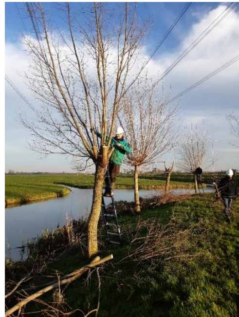
Vrijwilliger aan het werk bij Honderdschelaantje

Het knot- en snoeiseizoen is in volle gang. Met inachtneming van de richtlijnen van het RIVM gingen de vrijwilligers van Knotgroep Breukelen op 5 december aan de slag. Op het Honderdschelaantje (Nieuwer ter Aa) waren de knotbomen onder de hoogspanningsmasten het eerst aan de beurt. Bij warm weer buigen de kabels erg door, en het is niet de bedoeling dat de wilgen geraakt worden. De verschillende vrijwilligersgroepen die in ons werkgebied actief zijn, kunnen u vaak voor een kleine bijdrage helpen met knot- en snoeiwerkzaamheden. Voor meer informatie kunt u contact opnemen met uw gebiedsregisseur .