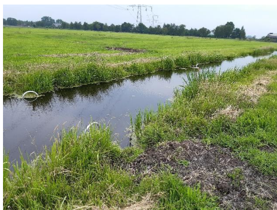
Eindbuisbescherming polder Kortrijk

Na een voortvarend begin met de aanleg van waterinfiltratiesystemen (WIS) in de polders van Kortrijk en Portengen in juli, moesten de werkzaamheden door de droogte worden stilgelegd. Van de 230 ha was toen bijna 20% gerealiseerd.