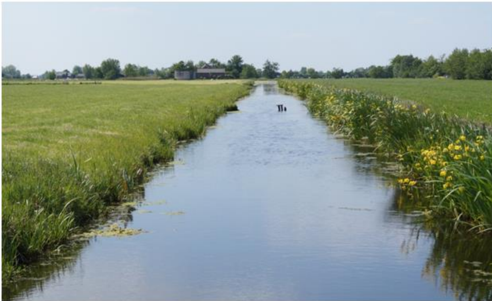
Zo kan het ook, het ene jaar de ene kant en het andere jaar de andere kant

Ecologisch slootschonen wil zeggen dat bij het schonen rekening wordt gehouden met de flora en fauna in de sloot. Door het juiste materiaal op de juiste werkwijze in te zetten krijgen slootdieren de kans om te vluchten. Een deel van de waterplanten mag in de sloot blijven staan en tijdens het schonen worden wortels zo min mogelijk beschadigd. Door het slootmateriaal niet in de talud maar op of over de insteek af te zetten is er minder uitspoeling van voedingsstoffen naar de sloot.